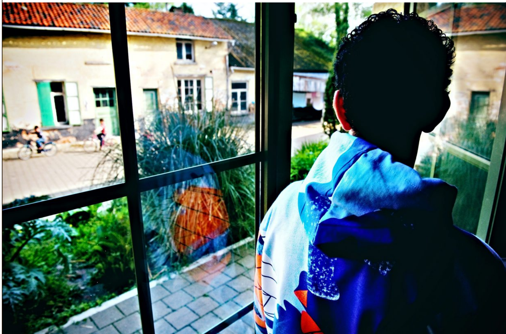
De kinderen die Minor-Ndako ziet, zijn meestal via de Balkanroute gereisd, met andere kinderen en volwassenen. Sommigen zijn wees.