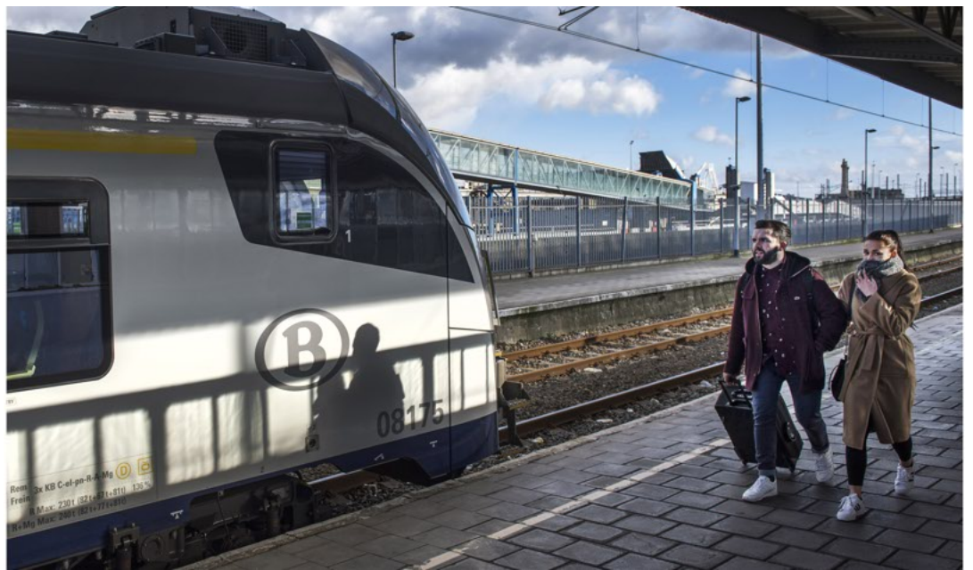
Reizigersorganisaties vinden de Desiro-stellen een veredelde metro, bedoeld voor korte afstanden.

Het jongste kind was zeven jaar, een meisje uit Syrië. In een groepje van vier, met haar nichtje, aan Brussel-Noord gedropt