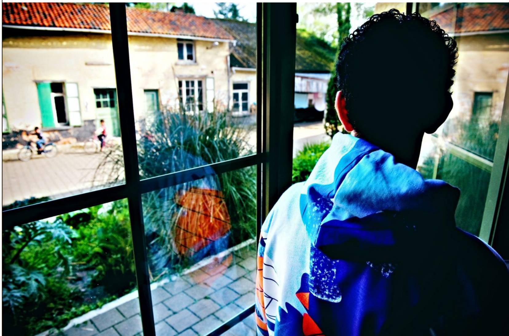
De kinderen die Minor-Ndako ziet, zijn meestal via de Balkanroute gereisd, met andere kinderen en volwassenen. Sommigen zijn wees.

‘De ministers Van Overtveldt en Tommelein hebben negen dagen om iets te doen’